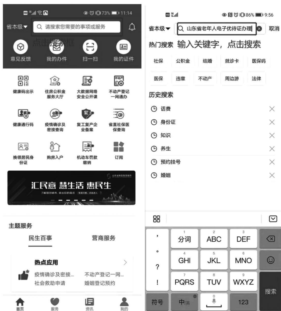
图1 老年人电子优待证办理入口